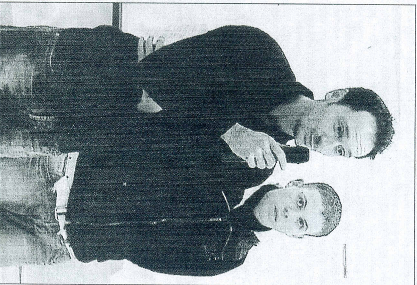
Dans le regard de ce jeune étudiant se lit l'incompréhension.

Comment en effet, soutenir qu'il soit indispensable de fermer la section du lycée de Chelles qui fait le plein avec ses dix-huit élèves pour dix-huit places alors que l'Académie de Créteil connaît la saturation avec Meaux (35 étudiants) ou Meulan (24 étudiants) ? De plus, les